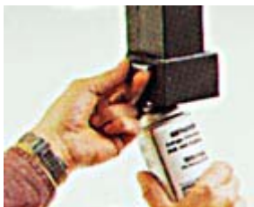
卡入式，不漏墨設計