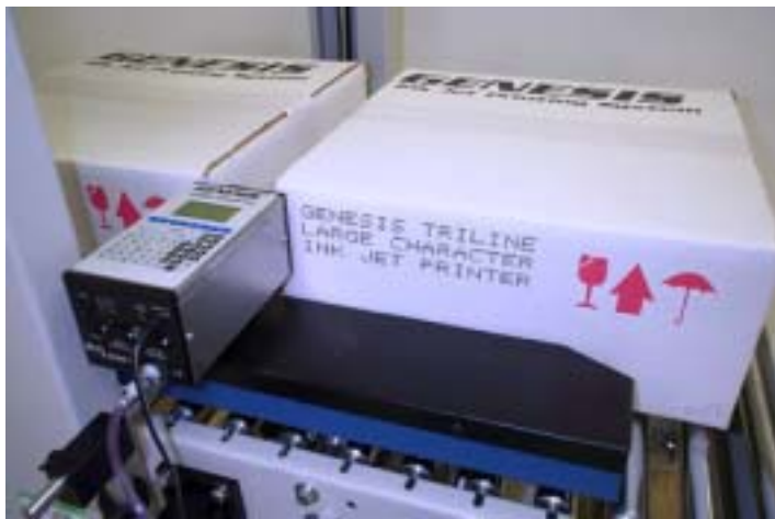
TriLine(三列) 大字體噴印機